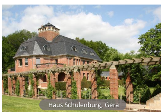
Haus Schulenburg, Gera